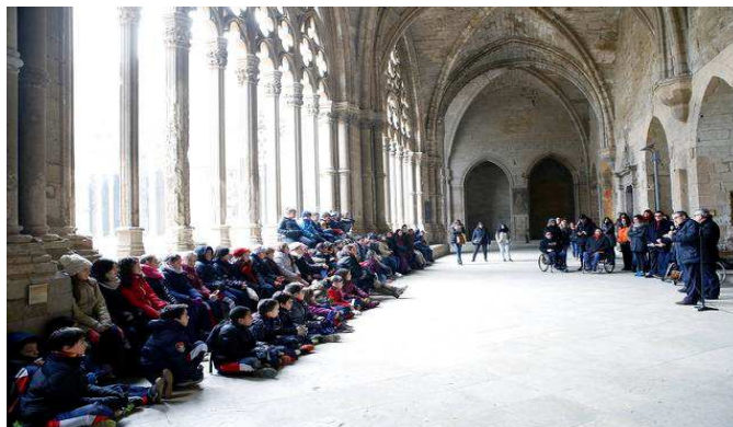
Àrea d'atenció a les persones amb discapacitats

Amb aquesta acció, vàrem convidar a dues escoles de la ciutat de Lleida, la Sagrada Família i Josep Calassanç i a nois i noies de l'associació Síndrome de Down per tal de que poguessin viure aquesta experiència de viure per uns instant com una persona amb discapacitat