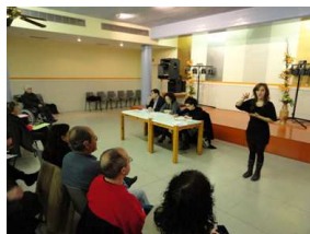
Àrea d'atenció a les persones amb discapacitats

Durant aquest anys s'han portat a terme 32 serveis d'interpret de llengua de signes , en aquells actes d'interès col·lectiu per a tota la ciutadania, com pregó de Festa Major de maig (acompanyament en els actes més importants a la pubilla silenciosa), el prego de Festa major de setembre, l'eucaristia de Sant Anastasi, els parlaments del reis d'orient, la Jornada d'Innovació Social, Entrega de Premis de l'Empresa Solidaria, caminades populars organitzades per entitats i associacions de Lleida on varen assistir persones amb discapacitat auditiva, i des del mes de juliol la interpretació dels Plens municipals, entre altres.