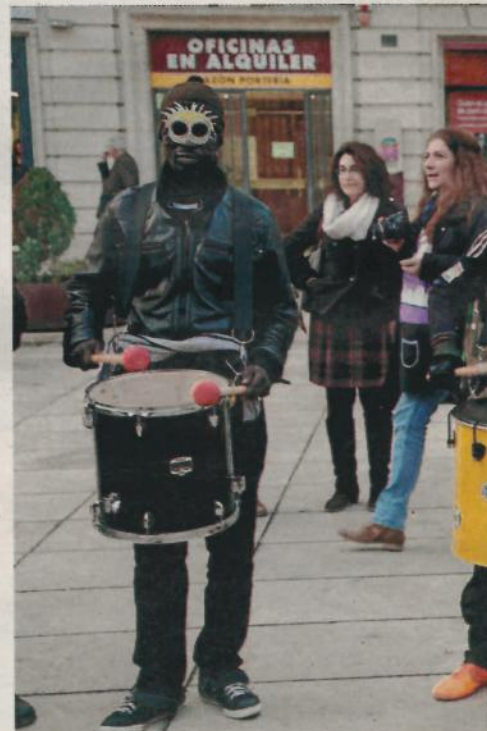
BATUCADA. El taller de percussió va participar a la rua de Carnaval.