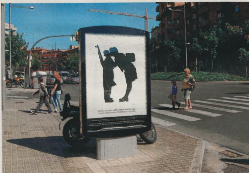
DENÚNCIA. Intervenció artística en tanques publicitàries de la ciutat.