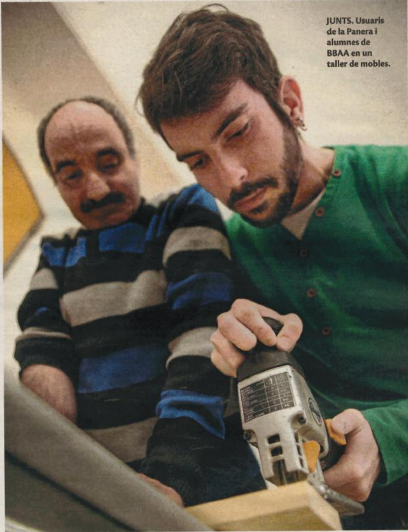
JUNTS. Usuaris de la Panera i alumnes de BBAA en un taller de mobles.